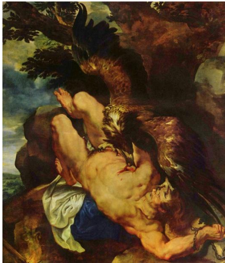
El tormento de Prometeo Peter Paul Rubens Museo de Oldenburg