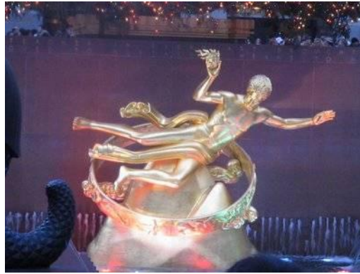
Escultura de Prometeo Rockefeller Center Paul Manship